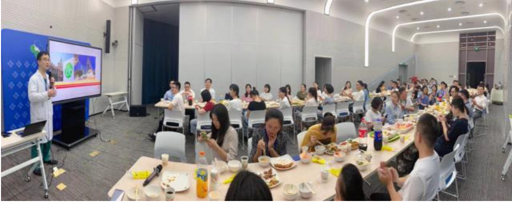
▲ 住培医师高桌晚宴（High Table Dinner）