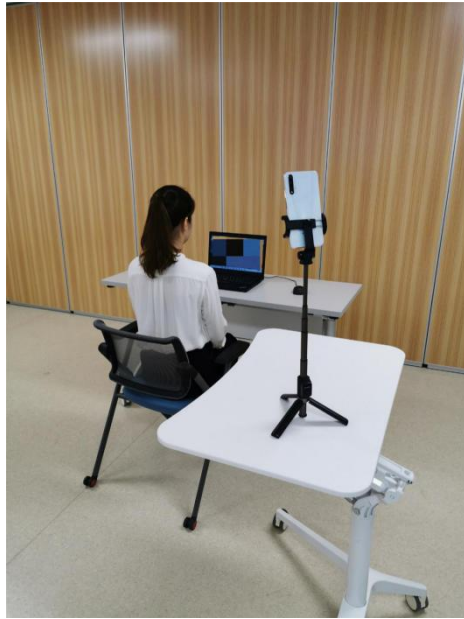
考生面试设备（含摄像头、话筒、扬声器）及侧面摄像头位置图